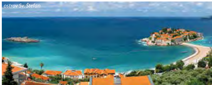
ostrov Sv. Štefan