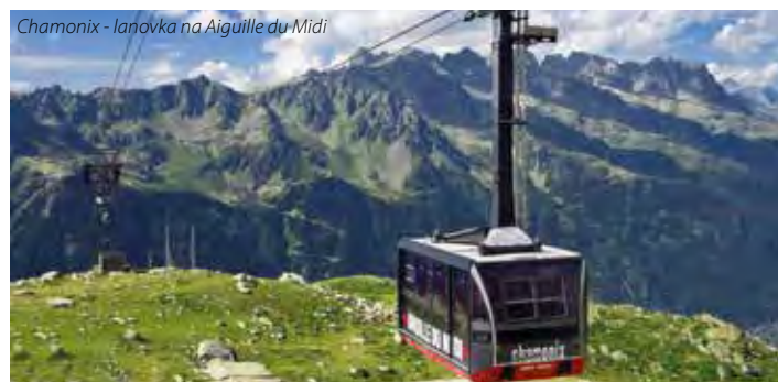
Chamonix - lanovka na Aiguille du Midi

8. den: příjezd do ČR v nočních nebo ranních hodinách.