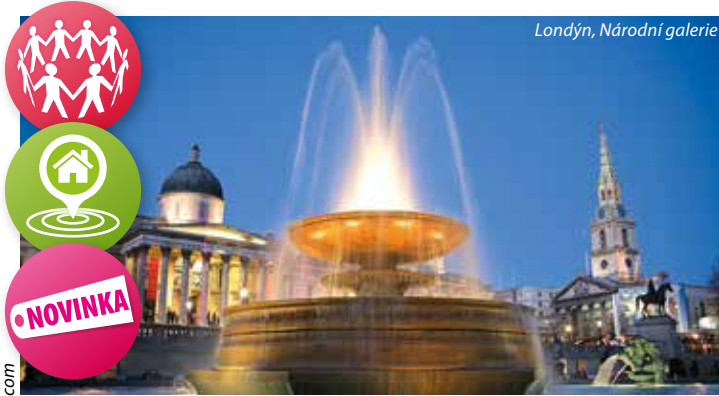
Londýn, Národní galerie

1. den: odlet z Prahy v poledních hodinách, přilet do Londýna, ubytování, odpolední procházka po nejdůležitějších památkách Londýna: Buckinghamský palác (sídlo královny Alžběty II.), Westminster Abbey (místo korunovace panovníků), Houses of Parliament se symbolem Londýna – Big Benem, Zahrady za věží Victoria (zde budeme moci obdivovat sousoší Občané z Calais od A. Rodina), Trafalgarské náměstí s Národní galerií a Nelsonovým sloupem, Piccadilly Circus se sochou Erose, Leicester Square , rozjímání u voňavých obchůdků a stánků v Covent Garden , ze kterých dýchá stará dobrá Anglie, příjemným bonusem bude večere v pubu