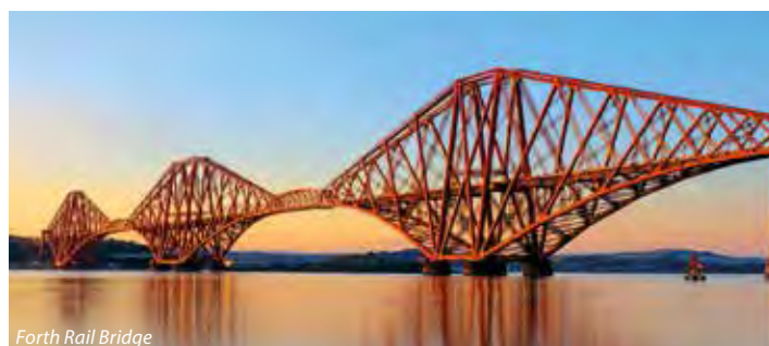
Forth Rail Bridge

3. den: dopoledne návštěva královské jachty Britannia (v ceně český audioprůvodce), která do roku 1997 sloužila královně a její rodině (na této lodi prožili své líbánky princ Charles a Diana) – nikde jinde nepoznáte život královské rodiny tak zblízka jako právě zde, jedinečná exkurze po nádherné lodi je zároveň exkurzí do soukromí královské rodiny (vyřazení jachty z provozu královna oplakala), polední rozjímání na Princes Street (výkladní třída gregoriánské architektury ), v případě pěkného počasí piknik v zahradách u Památníku W. Scotta , odpoledne volný čas na procházky „Novým Městem“; vše doporučujeme odpolední fakultativní výlet vlakem (s naším průvodcem) do malebné skotské vesničky North Queensferry u zálivu Firth of Forth, odkud se vám naskytou nádherné pohledy na unikátní železniční most Forth Rail Bridge (UNESCO), možnost posezení v typické skotské hospůdce, návrat do Edinburghu v podvečerních hodinách