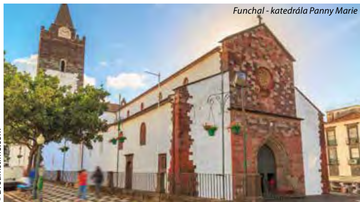
Funchal - katedrála Panny Marie

8. den: pojedete podél západního pobřeží Madeiry; zastavíte se na nejzápadnější vyhlídce nad Atlantikem u majáku PONTA DO PARGO , v malém přístavu PAUL DO MAR , v RIBEIRA BRAVA – pobřežní město sevřené v hlubokém údolí, možnost koupání; navštívíte CABO GIRAO - 580 m vysoký útes nad mořem s výhledem na jižní pobřeží; navštívíte rybářské městečko CAMARA DE LOBOS s malebným přístavem a barevnými lodkami; pěšky podle levády DOS PIORNAIS - leváda prochází banánovými políčky a následuje úsek vytesaný ve skále s krátkými tunelky (50 min. podle levády a pak 15 min. výstup k busu); dojedete do FUNCHALU – hlavního města, kde strávíte poslední 3 noci