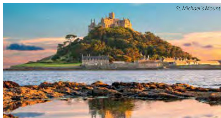
St. Michael's Mount

5. den: po snídani přejezd do lázeňského města lázeňského města Bath : nenáročná procházka mezi skvosty gregoriánské architektury: Pulteney Bridge, The Circus, Royal Crescent, Bath Abbey (nádherná katedrála se soškami šplhajícími andlíků), volný čas na prohlídku The Roman Baths – 2000 let starého lázeňského komplexu založeného Římany; volný čas na nákup suvenýrů; odpoledne transfer na letiště; odlet do Prahy v podvečerních hodinách