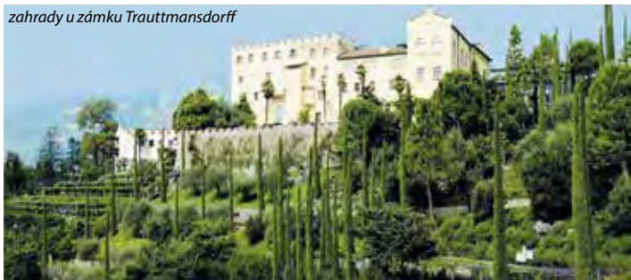
zahrady u zámku Trautmannsdorff

4. den: po snídani pojedeme do nejnávštěvovanějších provincií v oblasti Trentino, která je nazývána „Brána Dolomit“. Poznáme nejhezčí údolí Dolomit Val di Fassa a Val di Fiemme s nejkrásnějšími výhledy na nejvyšší vrchol Dolomit, masív a ledovec Marmolada (3 343 m n.m.). Krásné scenérie, náhorní plošiny, samoty a horské vesnice v téměř nedotčené přírodě s typickým alpským vysokým pohořím a údolím s řekou Avisio. Panoramatické cesty s jedinečnými výhledy, dle počasí výjezd lanovkou ( Sass Pordoi ) s nenáročnou pěší turistikou dle fyzické zdatnosti. Přesun údolím Val Gardena s ladinským obyvatelstvem, tradičním horským zemědělstvím se zaměřením na pastevectví a dřevěnou zbudu. Večeře v hotelu.