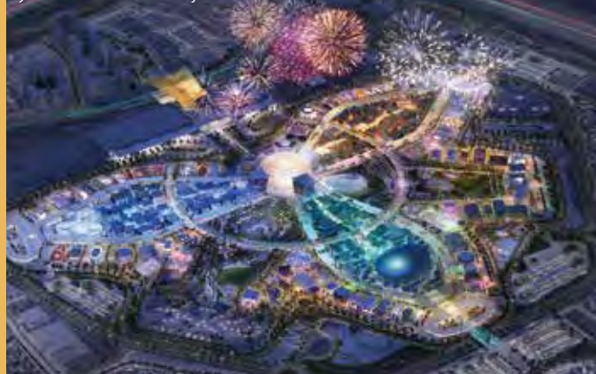
výstaviště EXPO 2020 Dubaj

Více informací, termínů a nabídek na: www.zajezdyexpo.cz