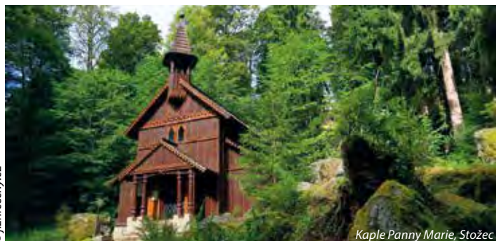
Kaple Panny Marie, Stožec