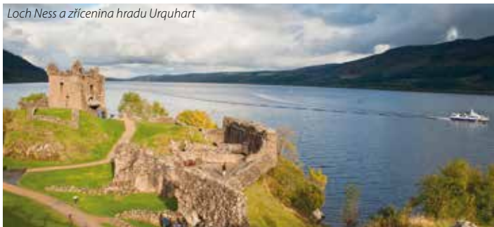
Loch Ness a zřícenina hradu Urquhart

5. den: odlet do Prahy (přímý let) v časných ranních hodinách