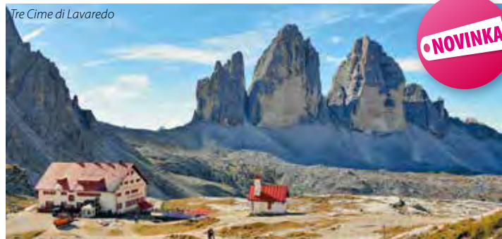
Tre Cime di Lavaredo