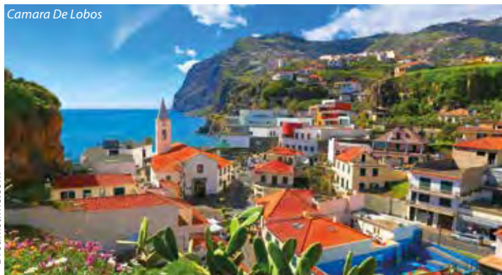
Camara De Lobos

Zveze Vás na hornatý portugalský ostrov, ležící 700 km na západ od Maroka a 960 km od Lisabonu. Je protkán množstvím zavlažovacích kanálů - levád , podél nichž vedou turistické stezky s nádhernými výhledy zejména na Atlantik. Při první vycházce kamkoliv zjistíte, že se mu právem říká ostrov „věčného jara“ . Všude Vás totiž provází místní flóra, kvetoucí téměř celý rok. Výlety do hor a koupání v Atlantiku můžete doplnit pitím madeirského vína. Mimořádně příznivé jsou zdejší klimatické podmínky. Průměrná teplota vzduchu v zimě neklesá pod 16°C a hlavně v létě nevystupuje nad 26°C. Teplota vody v létě je v rozmezí 20°–22°C. Ostrov přímo vybízí turistu, aby ho přiletěl prozkoumat a zažít. Jestli jste teď dostali chuť ostrov prochodit, kochat se výhledy nejen od levád, ale i z horských masivů, koupat se v oceánu – poznat přírodní krásy ostrova - je tento program zájezdu ušit na míru právě Vám.