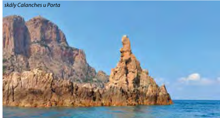
skály Calanches u Porta

5. den: Bonifaccio – tzv. Gibraltar Korsiky , zde doporučujeme asi 1,5 hod plavbu lodí kolem jeskyně a vápencových skalních útvarů s výhledy na domy posazené na útesech, v Bonifacciu kolem přístavu vystoupáme do opevněného města s typickými uličkami, kde se z mnoha míst naskýtají překrásné výhledy na okolí a na Sardinii. Je možné sestoupit po schodech krále aragonského (ručně tesané schodiště z r. 1420 se 187 stupni), které se tyčí nad mořem a klesá až k mořskému břehu.