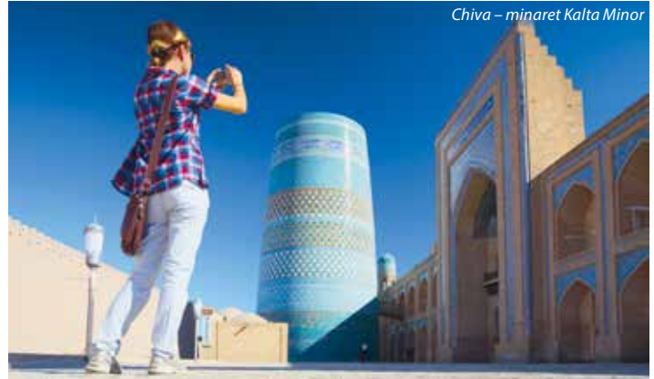
Chiva – minaret Kalta Minor

10. den: ráno odjezd z Buchary, poté přesun pouští Kyzylkum (název podle charakteristické červené barvy písku) busem k pevnosti Ayaz Kala v karakalpacké oblasti , která byla postavena za období chorezemských šáhů. Folklorní hudební večer s tancem, karakalpacká večere (v ceně zájezdu), ubytování v jurtách