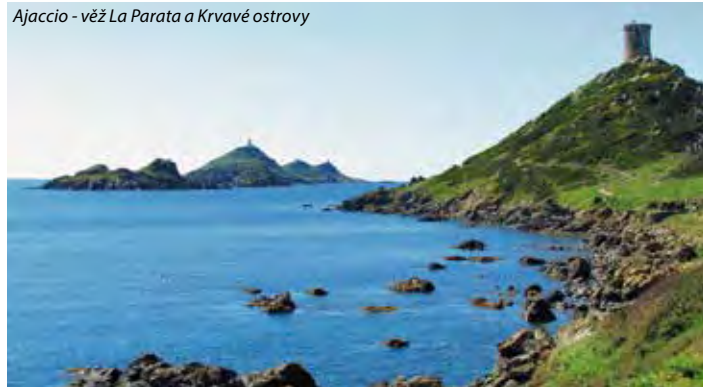
Ajaccio - věž La Parata a Krvavé ostrovy

Pro ty, kteří rádi kombinují poznávání s odpočinkem u moře, nabízíme Korsiku, nazývanou ostrovem krásy či perlou Středomoří. Korsika nadchne své návštěvníky barvami a vůněmi přírody, azurovým mořem s písčnými plážemi v malebných zátokách, nad nimiž se zdvihají vrcholky hor. Nezapomenutelná jsou korsická města a přístavy Porto, Ajaccio a Bonifaccio, které je díky svým bělostným útesům řazeno mezi největší pozoruhodnosti Evropy.