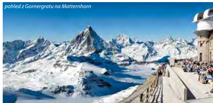
pohled z Gornergratu na Matterhorn

Doporuč. kapesné na lanovky a vlaky: 180 CHF a 30-50 EUR