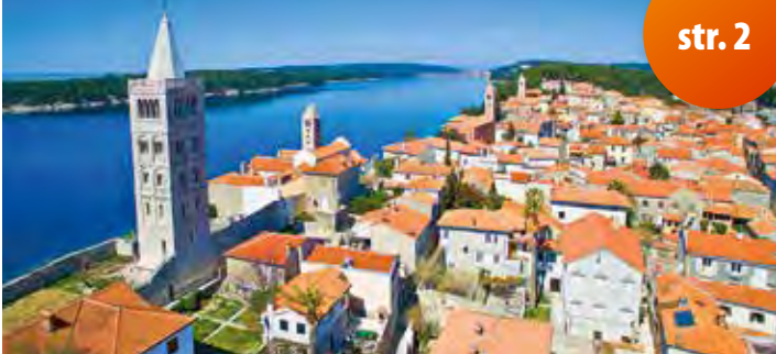
Chorvatsko - Rab

První část katalogu je zaměřena na pobyty u moře , kde je největší zájem stále o Jaderské moře v Chorvatsku . Již od roku 1992 s námi naši klienti jezdí na jeden z nejslunnějších ostrovů v Chorvatsku na ostrov Rab . Ve střední Dalmácii patří k oblíbeným destinacím Vodice, Primošten a Sv. Filip a Jakov. Novinkou je letovisko Sabunike u Ninu nedaleko Zadaru, které se pyšní Králjičinou pláží, jednou z 10 nejkrásnějších pláží v Chorvatsku. V jižní Dalmácii je náš nejnavštěvovanější destinací letovisko Orebič na poloostrově Pelješac. Ubytování v Chorvatsku je zajištěno v příjemných apartmánech, v pensionech a hotelech všech kategorií se stravováním včetně all inclusive. V Itálii nabízíme pobyty ve velmi oblíbených letoviscích Lignano, Jesolo, Bibione, Rosolina Mare a především Caorle, kde jsou možné pobyty i na zkrácený počet 3, 4 nebo 6 dnů. Ve střední Itálii je oblíbená Cupra Marittima, především pro skupiny s jógou či aerobikem a pro hudební nebo pěvecké soubory, jež zde mohou koncertovat.