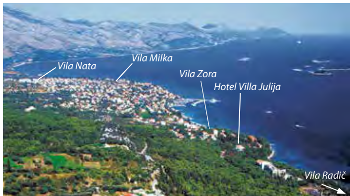
Celkový pohled na Orebič

Centrum Orebiče: od přístavu směrem k pláži Trstenica vede podél moře pěší promenáda, která ožívá zejména ve večerních hodinách, najdete zde restaurace, pizzerie, kavárny... Budovy v historickém centru s kostelem pocházejí z 15.–17. st., historii zdejšího loďářství přibližuje Námořní muzeum.