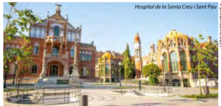
Hospital de la Santa Creu i Sant Pau

3. den: po snídani návštěva Parku Güell (nutná rezervace předem), postaveného na barcelonské stráni s výhledem na moře, kde exotickou zeleň doplňují Gaudího mozaiky, draci, schodiště, kamenná podloubí a fantazie; v poledních hodinách transfer na letiště, odlet do Prahy.