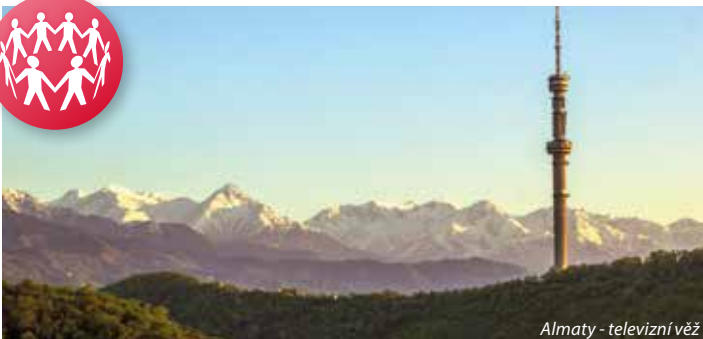
Almaty - televizní věž