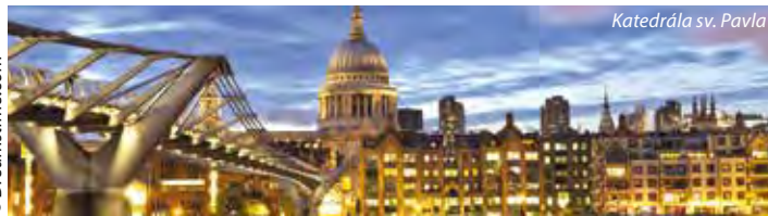
Katedrála sv. Pavla

4. den: dopoledne komentovaná návštěva Britského muzea s odborným výkladem specialisty na historii umění; odpoledne volný čas a poté transfer na letiště a v podvečer odlet do Prahy