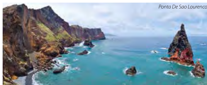
Ponta De Sao Lourenco

4. den: navštívíte východní část Madeiry; PONTA DE SAO LOURENCO - skalnatý poloostrov téměř bez porostu, projdete po úzkém hřebeni, který je omýván oceánem ze dvou stran, až k farmě Casa do Sardinha; možnost výstupu na kopec nad farmou (148 m – 1,5 hodiny chůze od busu) s výhledem až k majáku; pro zájemce koupání na malé oblázkové pláži; návrat k busu (celkem max. 3 hodiny chůze nebo méně); PRAINHA – koupání na přírodní pláži s černým písekem; po staré cestě po severním pobřeží dojdete do PORTO MONIZ , kde strávíte 4 noci