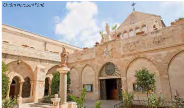
Chrám Narození Páně

6. den: po snídani budeme pokračovat v prohlídce hlavního města Izraele . Průvodkyně nás zavede do Židovské čtvrti s těmi nejžádanějšími památkami - Cardo, Menora a Zdi Námků, navštívíme i museum holokaustu Yad Va Shem . V Jeruzalémě budeme mít možnost vidět i další zajímavá místa. Večer se vrátíme do našeho hotelu k večeři a noclehu.