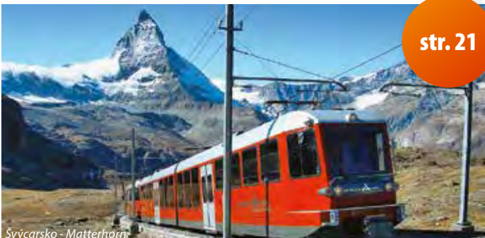
Švýcarsko - Matterhorn