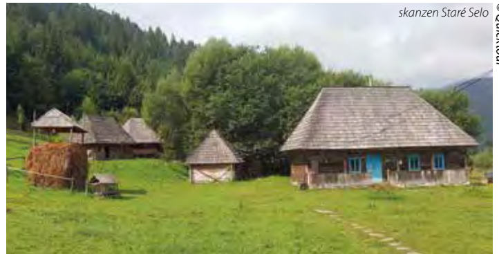
skanzen Staré Selo