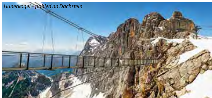
Hunerkogel – pohled na Dachstein

5. den: po snídani autobusem do Bad Aussee podél jezera Grundlsee do Gössl, odsud pěšky naučnou stezkou podél potoka Toplitz Bach cca 30 minut ke Toplitzsee, lodí po jezeře a dále ke Kammer See (pramen řeky Traun a vodopád), odjezd do ČR, příjezd do Prahy v pozdních večerních hodinách Během pobytu možnost navštívit lázně Grimming Therme v Bad Mitterdorf .