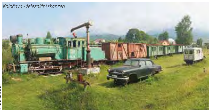
Koločava - železniční skanzen

7.den: příjezd v ranních nebo dopoledních hodinách