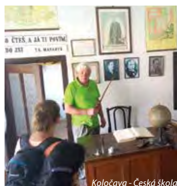
Koločava - Česká škola

3. den: po snídani odjezd k vodopádu Šipot , výjezd lanovkou do nádherné přírody zdejších Polonin a sestup k neznámějšímu vodopádu v oblasti. Cestou možná zhlédneme malé muzeum absurdity, které se zde každoročně koná před letní sezónou již od roku 1969. V programu bude následovat: Mizhirija (dříve Volovec) - krátká zastávka na tržišti okresního města, Siněvirské sedlo - fotopauza s výhledy na Zakarpátí, Siněvir - prohlídka záchranné stanice medvědů a odpolední procházka k Siněvirskému jezeru, dojezd do Koločavy , večeře, 2x nocleh