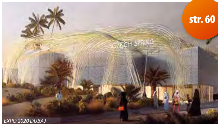
EXPO 2020 DUBAJ

Největší zájem na podzim a v zimě 2020 očekáváme o zájezdy na světovou výstavu EXPO Dubaj 2020-21 , kde je naše kancelář opět přímým partnerem Českého pavilonu . Zájezdy na EXPO budou i s prodlouženým pobytem v oblíbeném přímořském resortu Ras al Khaimah (v areálu hotelu je i golfové hřiště, pro hráče golfu ideální příležitost skloubit svoji zálibu s návštěvou EXPO). Více informací najdete na našem speciálním webu: www.zajezdyexpo.cz .