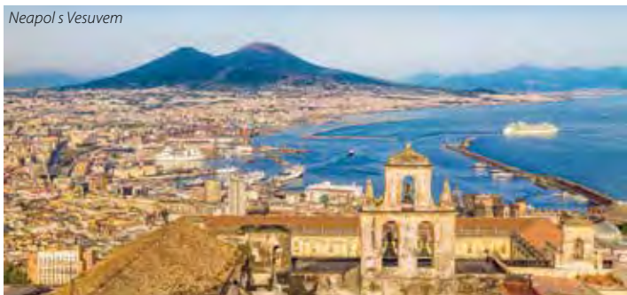
Neapol s Vesuvem

1. den: odjezd dopoledne z ČR přes Rakousko do Itálie, noční přejezd 2. den: lodí z Neapole nebo Sorrenta na ostrov Capri , jeden z nejkouzelnějších ostrovů Tyrhénského moře, městečka Capri a Anacapri , vila San Michele, možnost prohlídky Modré jeskyně a plavby kolem ostrova, relax a koupání, individuálně Neapol (UNESCO), královský palác, pevnost, ubytování u moře 3. den: celodenní pobyt u moře nebo fakult.výlet (min. 20 osob) za klenoty Amalfského pobřeží (UNESCO) s koupáním, Sorrento, přístavní letoviště, cesta lodí nebo busem, výhledy na Positano, starobylé Amalfí , kdysi námořní velmoc, dóm Sant Andrea z 9. st. v lombardsko-normandském sicílském stylu, krásné koupání , místní dopravou Ravello , skutečný klenot amalfského pobřeží, vesnička ve skalách, katedrála San Pantaleone, výhledy na Amalfské pobřeží, Villa Ruffolo ze 13. st., květinová zahrada, rezidence Villa Cimbrone , návrat na ubytování