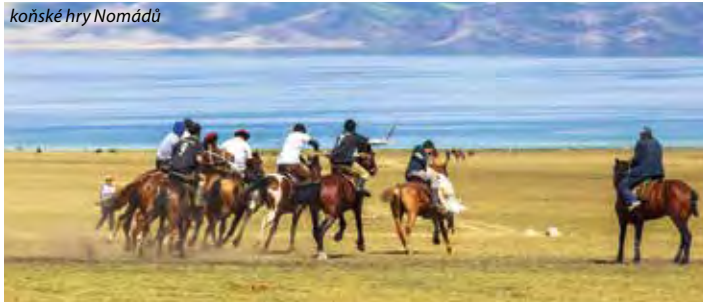
koňské hry Nomádů

3. den: dopoledne 40 minutový přelet do 2. největšího města země - Oš , prohlídka města: Sulejmanova hora – velkolepý skalní útěs s pěti vrcholy, který je zapsaný do UNESCO, hora patří po několik století k nejvýznamnějším poutním místům kyrgyzských muslimů. Dále navštívíme Báburův dům (zakladatel dynastie Mughalů a vnuk Timurův), třípatrovou jurtu a uvidíme i Leninovu sochu , nocleh.