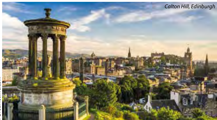
Calton Hill, Edinburgh

2. den: po snídani volný čas na prohlídku edinburské rezidence britského panovníka Palace of Holyroodhouse a jejich zahrad, poté procházka po další části Royal Mile (dům Johna Knoxe, City Chambers); oběd v jedné z restaurací na středověkém tržišti Grassmarket ; odpoledne volný čas na návštěvu muzeí a galerií nebo fakultativní výlet (realizovaný MHD) s průvodcem k nedaleké Rosslyn Chapel , která je právem považována za jednu z nejkrásnějších gotických kaplí ve Skotsku (známá díky bestselleru „Šíra mistra Leonarda“); večer volný čas na procházky nádherně osvětleným městem