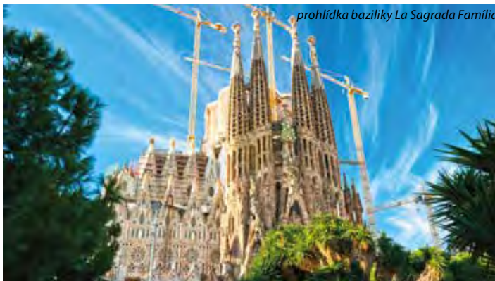
prohlídka baziliky La Sagrada Família

1. den: odlet v poledních hodinách z Prahy do Barcelony, ubytování v hotelu, odpolední procházka po centru města začne na bulváru Passeig de Gràcia s luxusními a značkovými obchody a dvěma secesními domy od katalánského architekta Antoni Gaudího – Casa Milá a Casa Batlló , prohlédneme si největší barcelonské náměstí Placa Catalunya , projdeme se bulvárem Las Ramblas , který je považován za skutečné srdce Barcelony (operní dům Liceu, tržnice La Boqueria, Kolumbův sloup) s kejkliři, trhy a živými sochami, podvečerní toulání křivolakými středověkými uličkami Gotické čtvrti , adventní trhy na náměstí před katedrálou Sv. Eulálie , fakultativně možnost večeře v typickém tapas baru. Doporučujeme večerní prohlídku domu Casa Milá (La Pedrera) – čeká Vás dražší, ale nezapomenutelný zážitek – kromě prohlídky nevšedního interiéru, který sám o sobě stojí za to, vystoupáte na střechu úžasného domu, kde si kromě nádherných výhledů na nasvětlené město užijete dech beroucí videomapping a před Vámi doslova ožije celý dům, prohlídka končí na nádvoří domu se sklenkou cava (katalánský sekt) v ruce.