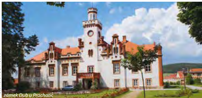
zámek Dub u Prachatic